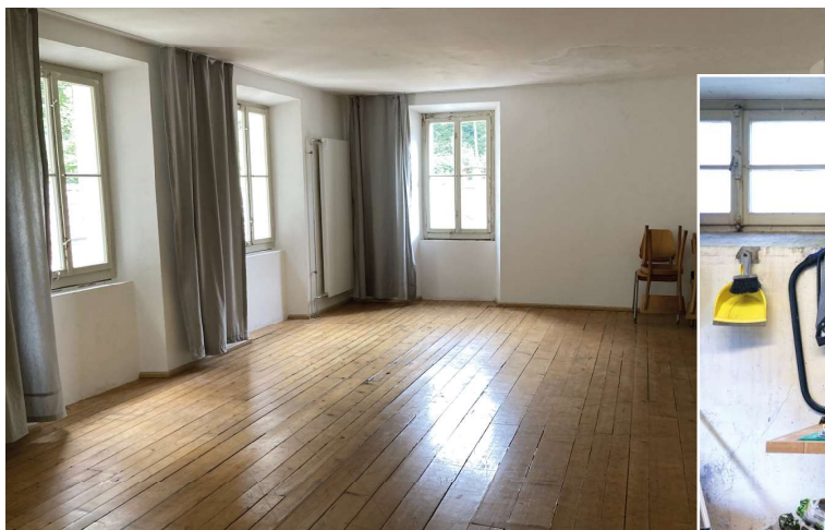
Uno dei tanti spazi di lavoro