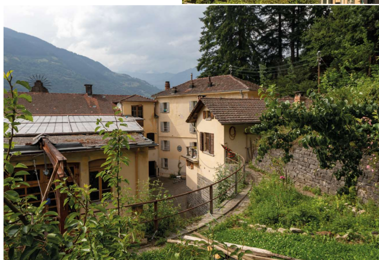
Cima Città è situata tra montagne, foreste e fiumi.