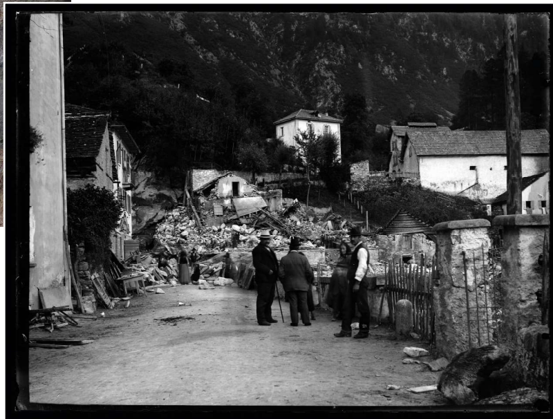
Alluvione del Soia e distruzione di parti della fabbrica Cima Norma nel 1908