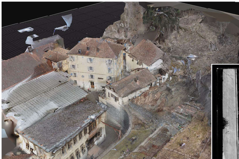
Immagine digitale di Cima Città con i locali sul retro e il giardino in primo piano