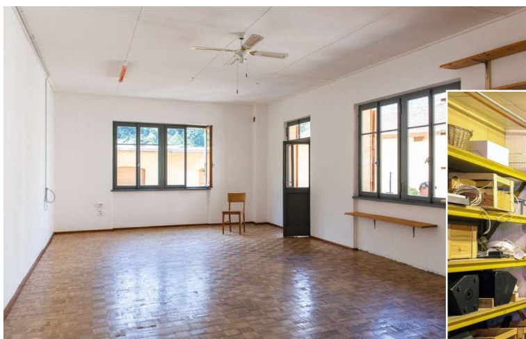
Spazio di lavoro e danza "Giorgio"