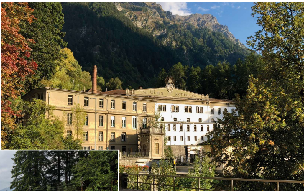
Vista della fabbrica da Dangio